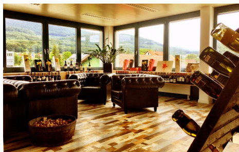
Unsere neue Lounge

auch optisch zu uns: grosszügig, hell, freundlich und offen. Die grosse Fensterfront im ganzen Raum sowie die offene Fläche lässt uns viel Freiraum in der Gestaltung. Das neue Herzstück ist klar der Loungebereich mit einer neu gestalteten Präsentationsfläche für unsere Topseller. Auf den grosszügigen und bequemen Chesterfield-Sofas